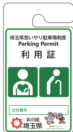
その他の高齢者、 障害者等用