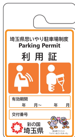
妊産婦、 けが人等用